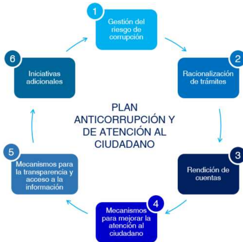
Gráfica #1. Componentes del PAAC